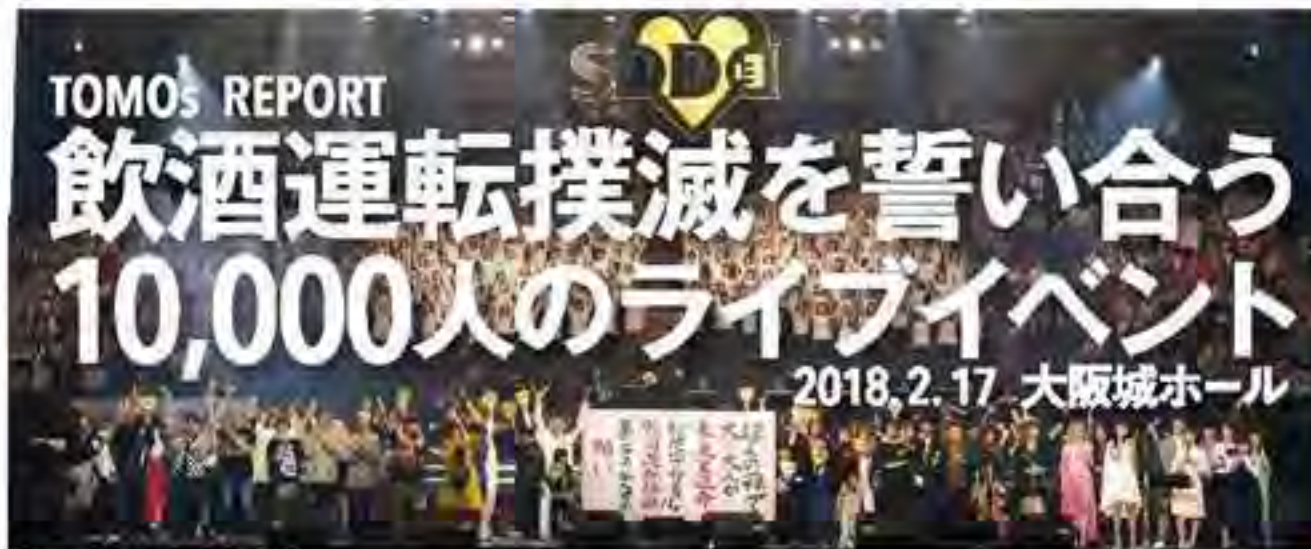
Official Photo (LIVE SDD 2018)