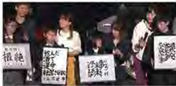
各ブロック・四都市の最優秀賞作品

SDD (STOP! DRUNK DRIVING) プロジェクトは、大阪のラジオ局FM OH! (FM OSAKA) が、飲酒運転を根絶することを目指し、二〇〇七年にスタートしました。五十以上の関連省庁や団体の後援をはじめ、約六十社のパートナーが参画し、集まった募金は毎年二千万円を超えています。「飲酒運転は絶対にしない」と誓い合い、その仲間を増やしていくことがSDDの目的です。