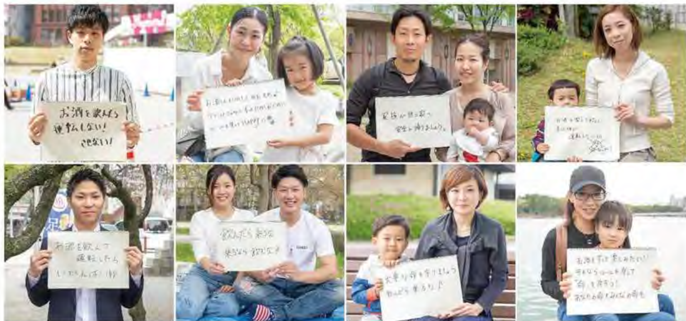
●お酒を飲んだら運転しない! させない! (学生) ●お酒はたのしくのむもの! 今だけじゃなく、ずっとたのしむためにルールを守ってHAPPYに(主婦) ●家族が待つ家へ安全に帰りましょう。(夫婦) ●お酒を楽しく飲んで車は絶対運転しない!! (主婦) ●お酒を飲んで運転したら いかんばい!! (大学生) ●飲んだら乗るな 乗るなら飲むな!! (カップル) ●大事な命を守りましょう 飲んだら乗るな! (主婦) ●お酒をずっと楽しみたい!! それならルールを守って「命」を守ろう! あなたの命もみんなの命も(主婦) (取材地:福岡市)