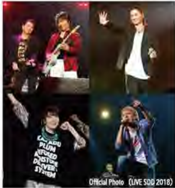
Official Photo (LIVE SDD 2018)