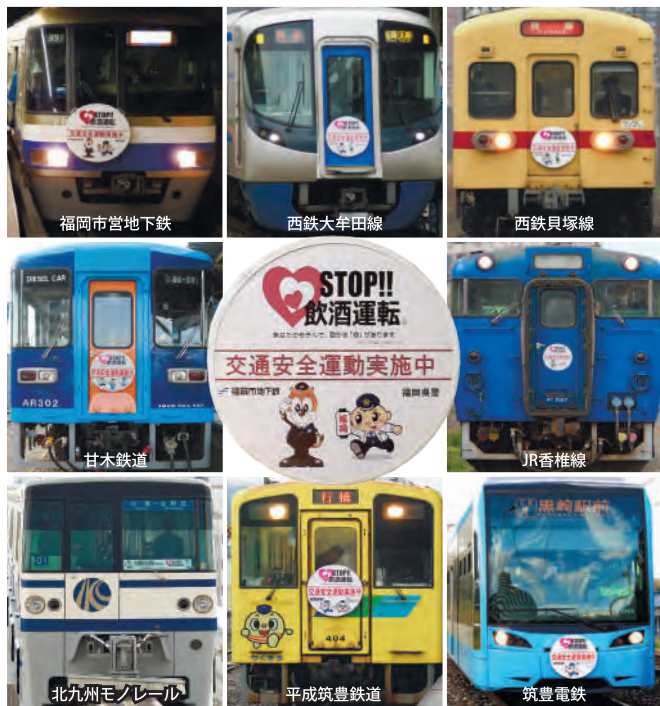
【協賛鉄道事業者】 ●甘木鉄道(株) ●九州旅客鉄道(株)・香椎線 ●西日本鉄道(株)／西鉄電車 ●筑豊電気鉄道(株) ●平成筑豊鉄道(株) ●福岡市交通局／福岡市営地下鉄 ●北九州高速鉄道(株)／北九州モノレール