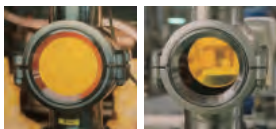
（左：ろ過前）にこりごりの状態（右：ろ過後）にこりが取れ、透き通ったビールに。

アサヒビール博多工場 福岡県福岡市博多区竹下3-1-1 ☎092-431-2701 JR博多駅より、ひと駅/JR鹿児島本線「竹下」駅下車・徒歩約3分