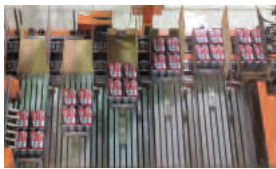
できあがったビールが缶に詰められ、出荷の準備が進んでいく。