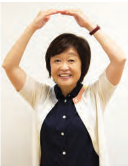
今日も一日、飲酒運転「ゼロ」を！

残されたものからも、失ったものからも、本当の価値を発見することができる。悲しい出来事を、ただ悲しんでいるだけでは、やはり苦しいですよ。そこから新しい社会をつくり、新しい自分の可能性を発見するんです。人生は何が起こるかかわらないけれど、どんなことから学んだり成長したりすることのできるチャンスは、きつとあるんだと思います。