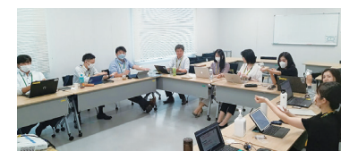
(上)アルコールパッチテストの様子

「社員の健康増進」と「飲酒問題の撲滅」を目的として、飲酒に関する一人ひとりの日常的な自己変革はもとより、その重要性を全役職員が再認識するために毎年11月を「ANAグループ適正飲酒推進月間」としています。その一方で、長年の飲酒習慣を変えることが困難な方々もいます。だからこそ、職場のサポートや組織のスキームによって、愛飲者に