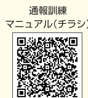
通報訓練 マニュアル(チラシ) 県ホームページ

お問い合わせ 福岡県 人づくり・県民生活部 生活安全課 (交通事故をなくす福岡県民運動本部)