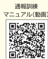
通報訓練 マニュアル(動画) 県警ホームページ