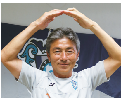
私たちは、飲酒運転「ゼロ」を応援します!!