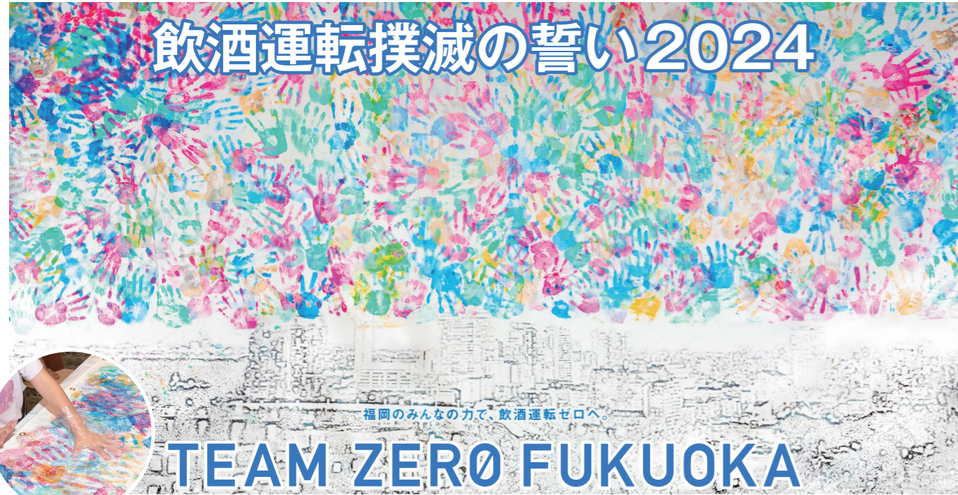
福岡のみんなの力で、飲酒運転ゼロへ。

あらゆる世代の人たちが 心をひとつにしてメッセー ジを発信していく―― 「チームゼロフクオカ」は、 私たち一人ひとりの「誓い」 を結束させて、飲酒運転 ゼロを目指します。