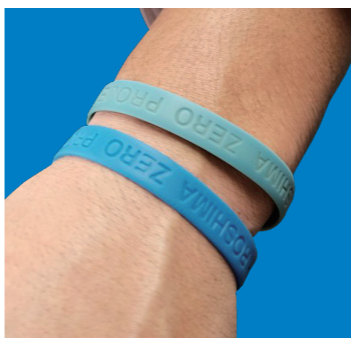
プロジェクトのシンボル、「ゼロ」のリストバンド。

中国新聞社が企画・運営している「HIROSHIMA 飲酒運転ゼロ PROJECT」は、二〇二二年にスタート。初年度、広島県の飲酒運転事故件数は一三一件でしたが、二〇二一年は六十五件と、十年間で半数以下となっています。各団体・企業、店舗など、地元の方々に協力をお願いし、子どもたちへの出前授業(紙人形劇)、アルコール依存症のご家族向け支援などの活動を継続してきました。