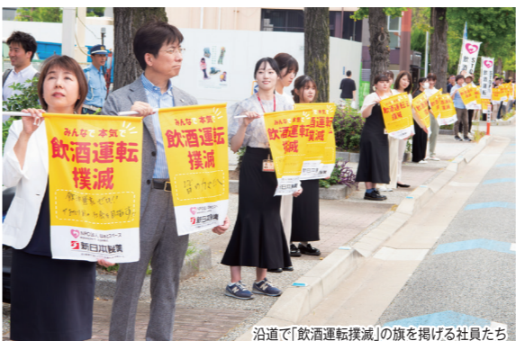
沿道で「飲酒運転撲滅」の旗を掲げる社員たち