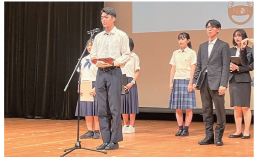
若者による飲酒運転撲滅宣言

平成18年8月25日に、福岡市・海の大道大橋で、飲酒運転の車によって、幼い三人の命が奪われてから18年。