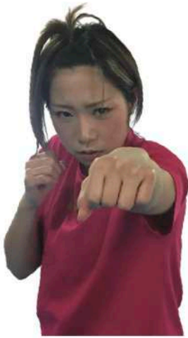
くろき ゆうこ 福岡市出身のプロボクサー。身長154cmのサウスポー。血液型はA型。YuKOフィットネスボクシングジム所属。WBC女子世界ミニフライ級王者で、初代WBC女子世界アトム級ユース王者。中村学園大学短期大学部卒業。